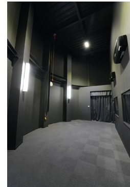
照度や拡散分布など様々な測定に対応した新築社屋内の暗室